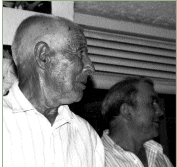
La comunicación efectiva deberá evitar modelos unidireccionales de relación. Foto círculos

Cualquiera que sea la modalidad elegida, para ser efectiva el comunicador tiene que saber escuchar. La comunicación se basa en establecer relaciones, consensuar ideas y valores y actuar acorde con ellos. Para que esto sea posible el punto de partida es la aceptación (incondicional) de los valores y prácticas de los otros, incluso si no tienen nada que ver o van en contra de la biodiversidad. La aceptación es el requisito para que los otros se abran. Escuchando podemos entender las percepciones de los destinatarios. En el ejemplo del director del Parque, esto significa tomar seriamente en consideración los valores y las prácticas de los sectores y