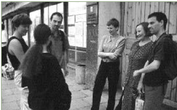
Sólo compartiendo, aceptando al otro y estableciendo un diálogo franco, se puede comunicar eficazmente. Foto cíclo

comportamiento sólo vendrá si es percibido por la población como algo que aporta más beneficios que costes. Muchas veces se orienta la comunicación en los beneficios que dicho cambio de comportamiento producirá en la biodiversidad, y no en los costes y beneficios para la población. Muy a menudo, el análisis coste-beneficio es realizado por expertos, sin consultar a los sectores implicados. Lo mejor sería consultarlos en "grupos focales", facilitando "tormentas de ideas" sobre un amplio rango de ideas y opciones. Para esto la comunicación es de gran ayuda.