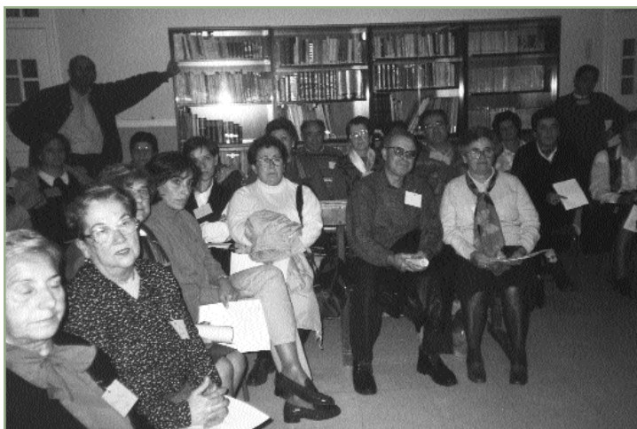
Las personas son algo más que simple estadística.

Si las personas no están motivadas a comportarse de manera adecuada, la dirección del Parque lo tiene difícil. Se necesita la comunicación para conseguir un cambio en las percepciones, valores y comportamientos de los destinatarios. El cambio de